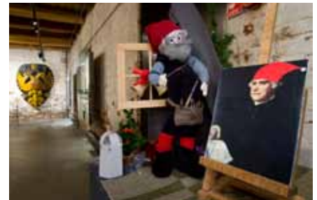
Suomenlinnan Joulutapahtuma 28.-29.11

Lippuja kierroksille myydään Suomenlinnakeskuksessa: aikuiset 7 e, lapset 3 e, Helsinki-kortilla vapaa pääsy.